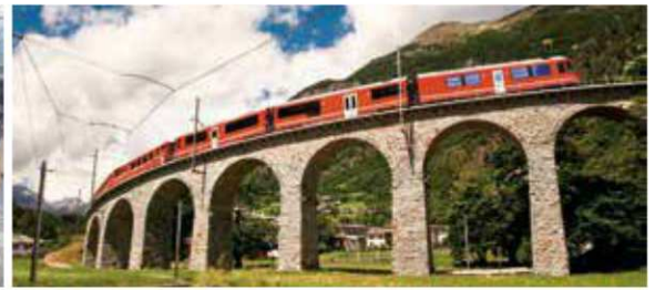
IFE liefert Türen für Hochgeschwindigkeitszüge, Regionalzüge oder Reisezüge.

E igentlich klang es nach guten Nachrichten. Trotz der Finanzkrise, die 2009 ihren Höhepunkt erreichte, kam beim Türenhersteller IFE ein Auftrag nach dem anderen herein. Das lag unter anderem an vielen Stimulus-Projekten, die in der Krise die Wirtschaft wieder ankurbeln sollten. Eine der erfolgreichsten Phasen der Unternehmensgeschichte zeichnete sich ab. Jedenfalls sah es so aus. 2009 wurde noch feierlich das neue Firmenhauptquartier im österreichischen Kematen eröffnet.